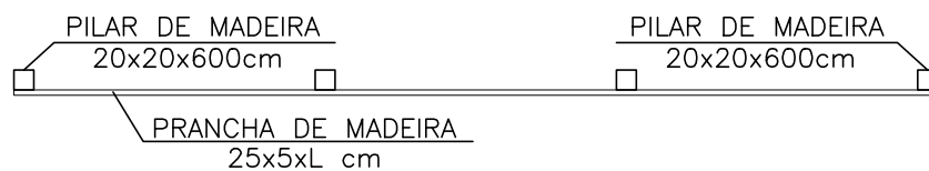
PLANTA GENÉRICA – VISTA SUPERIOR ESCALA: 1/75